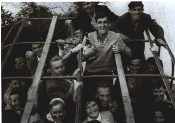
Na izletu s slovenskim planinskim društvom In gita con il Club alpino sloveno