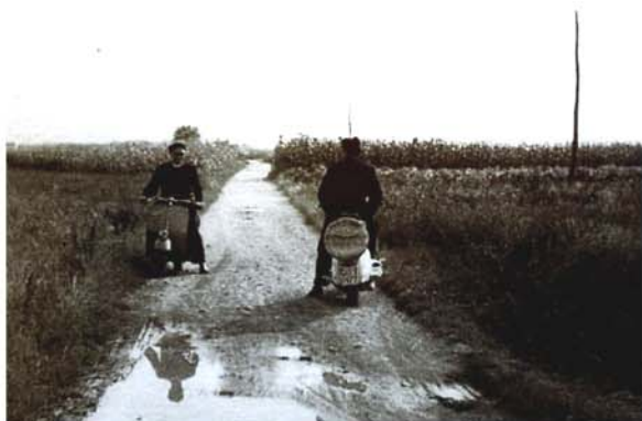
Dva duhovnika v službi Due sacerdoti in servizio