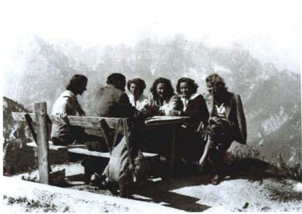
Sv. Višarje Monte Lussari