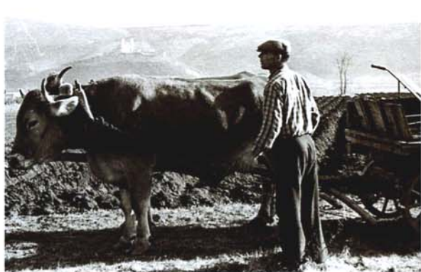
Oranje pri Mirenskem gradu Aratura sotto il castello di Merna