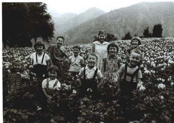
Otroci na krompirjevem polju Bambini in un campo di patate