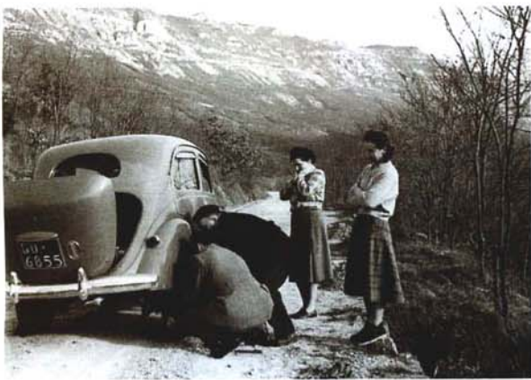
Majhna sitnost Piccolo inconveniente