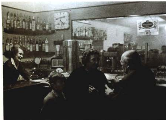
1967 - Kavarna Bratuž na dan njenega zaprtja 1967 - Il Caffè Bratuž il giorno della sua chiusura