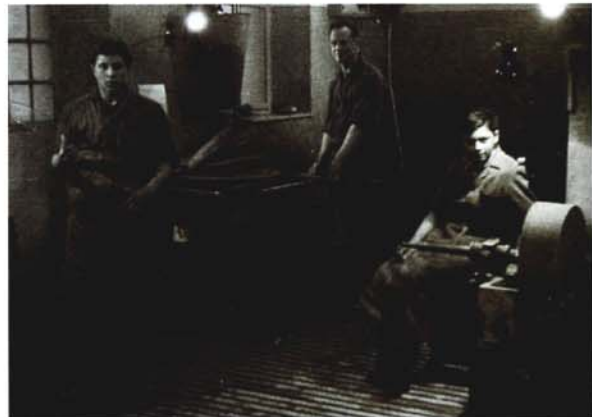
1954 - Steklarna Koren v ul. Bellinzona 19354 - La vetreria Koren in via Bellinzona (ex via Stretta)