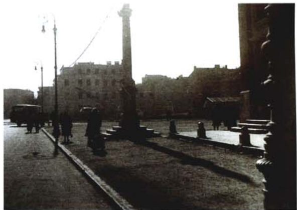
1938 - Travnik 1938 - Piazza Vittoria