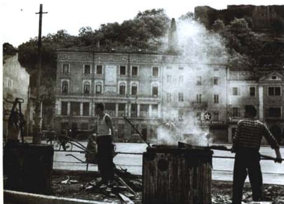
Asfaltiranje na Travniku Asfaltatura in Piazza Vittoria